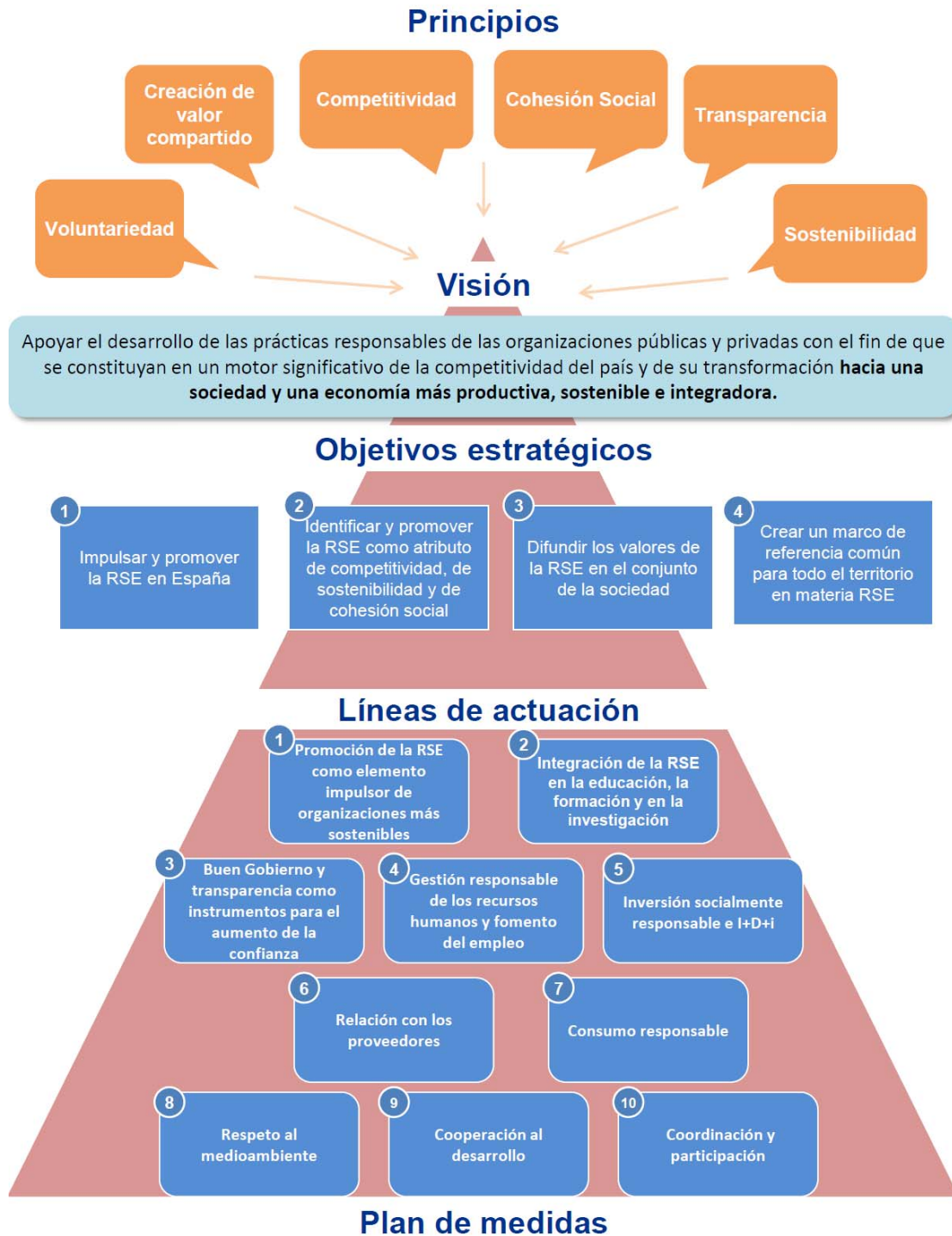
Cuadro 3: Estructura de la Estrategia Española de Responsabilidad Social de las Empresas